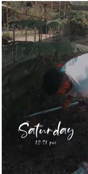
BOTANICAL GARDEN/ COLLEGE CAMPUS