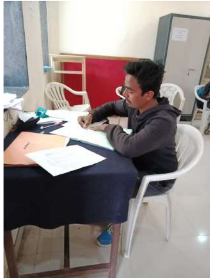
BOARD OF STUDENT WELFARE DEPARTMENT