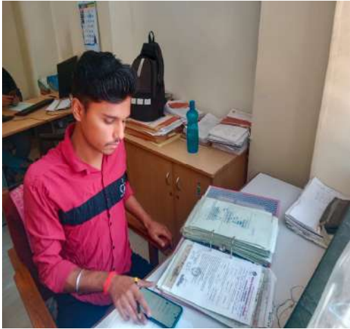
OFFICE (LC /TC SECTION)